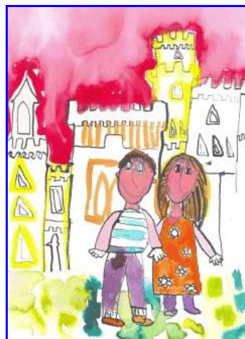
obrázek maloval Tomáš Jára