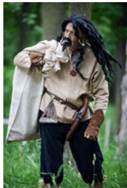
v červnu, kdy mají děti svátek a ty jediné

Jednu dobrou vlastnost ale přece měl. Měl rád děti a těm neubližoval. Jedině děti ho také mohou osvobodit, a to jen jednou za 100 let, aby už jako duch nemusel strašit. Může to být ale jen jednou za sto let, musí to být v červnu, kdy mají děti svátek a ty jediné mu mohou poradit: Jak o sobě pečovat! Jak se chovat!! A co je správné!!!