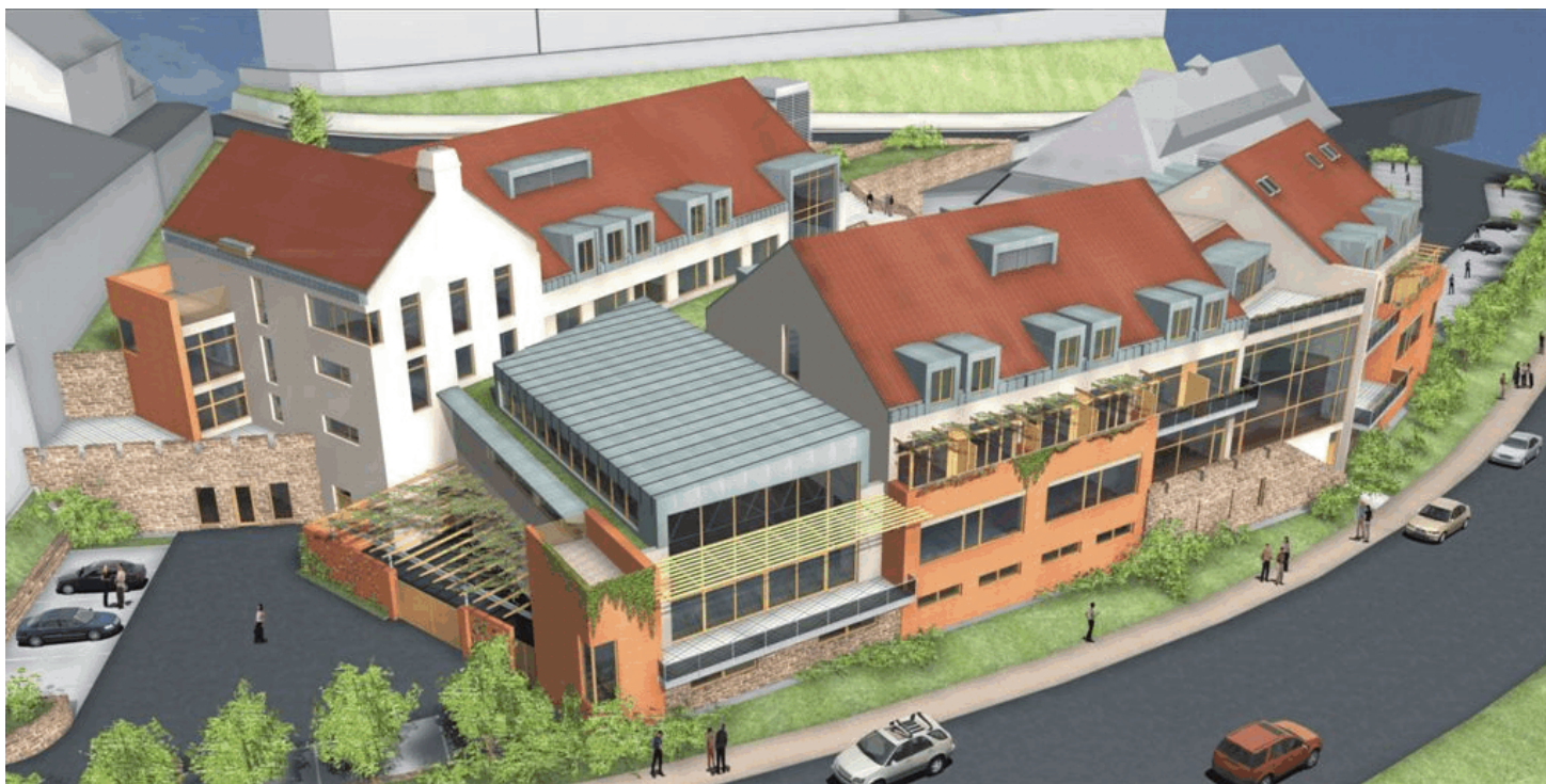
RELAXAČNÍ A REGENERAČNÍ CENTRUM HLUBOKÁ NAD VLTAVOU