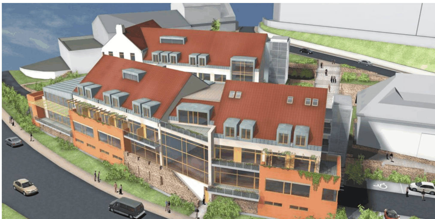
RELAXAČNÍ A REGENERAČNÍ CENTRUM HLUBOKÁ NAD VLTAVOU