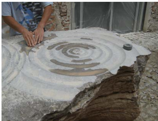
Foto: Eliška Růžičková, skulptura Kruhy na vodě , úplně vpravo skulptura, která zůstane v Českém Krumlově

pracuje nejen s kamenem, ale i se sklem, dřevem a jeho práce jsou krásné.