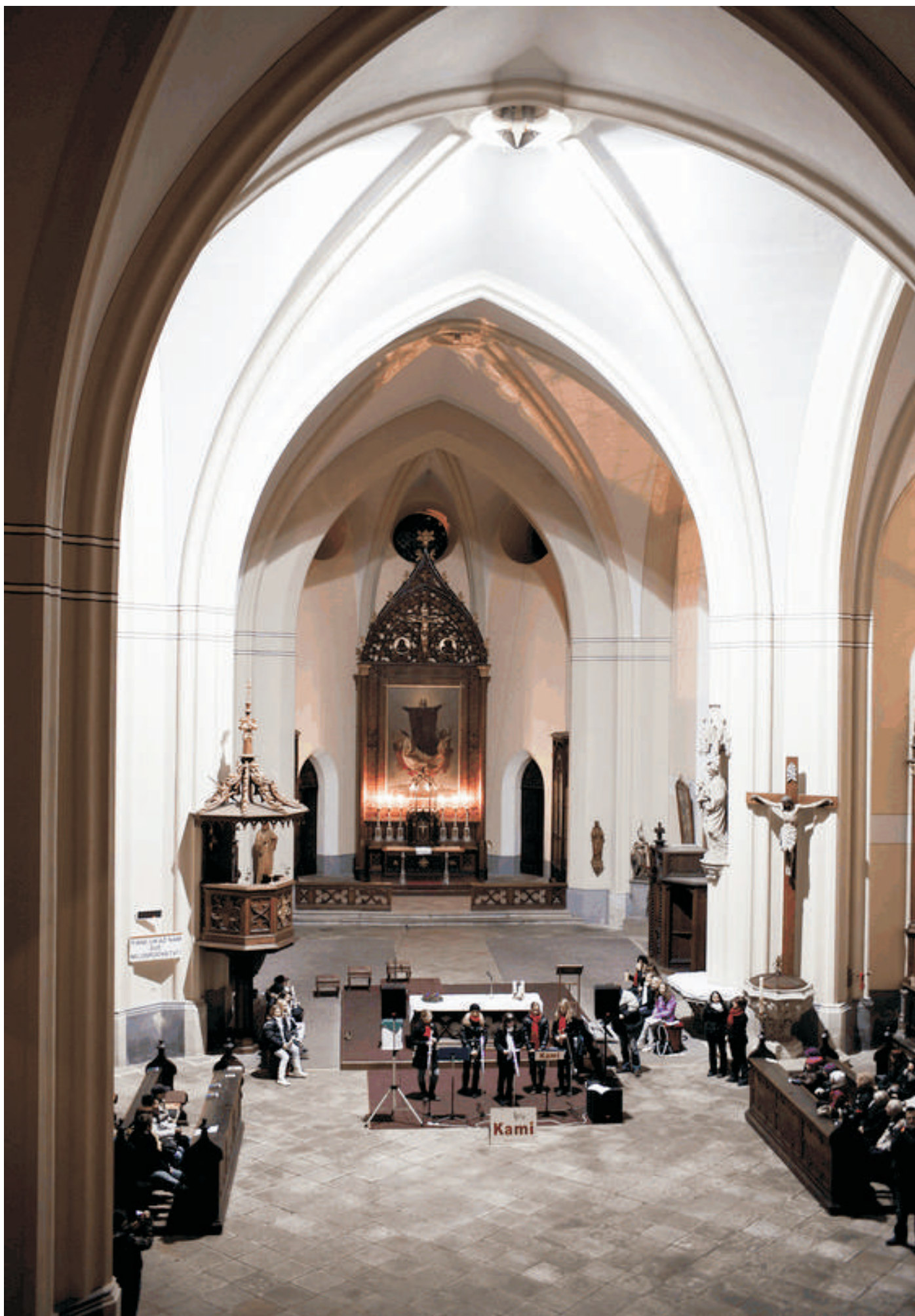
Kostel sv. Jana Nepomuckého, koncert ZUŠ Kami, prosinec 2011.