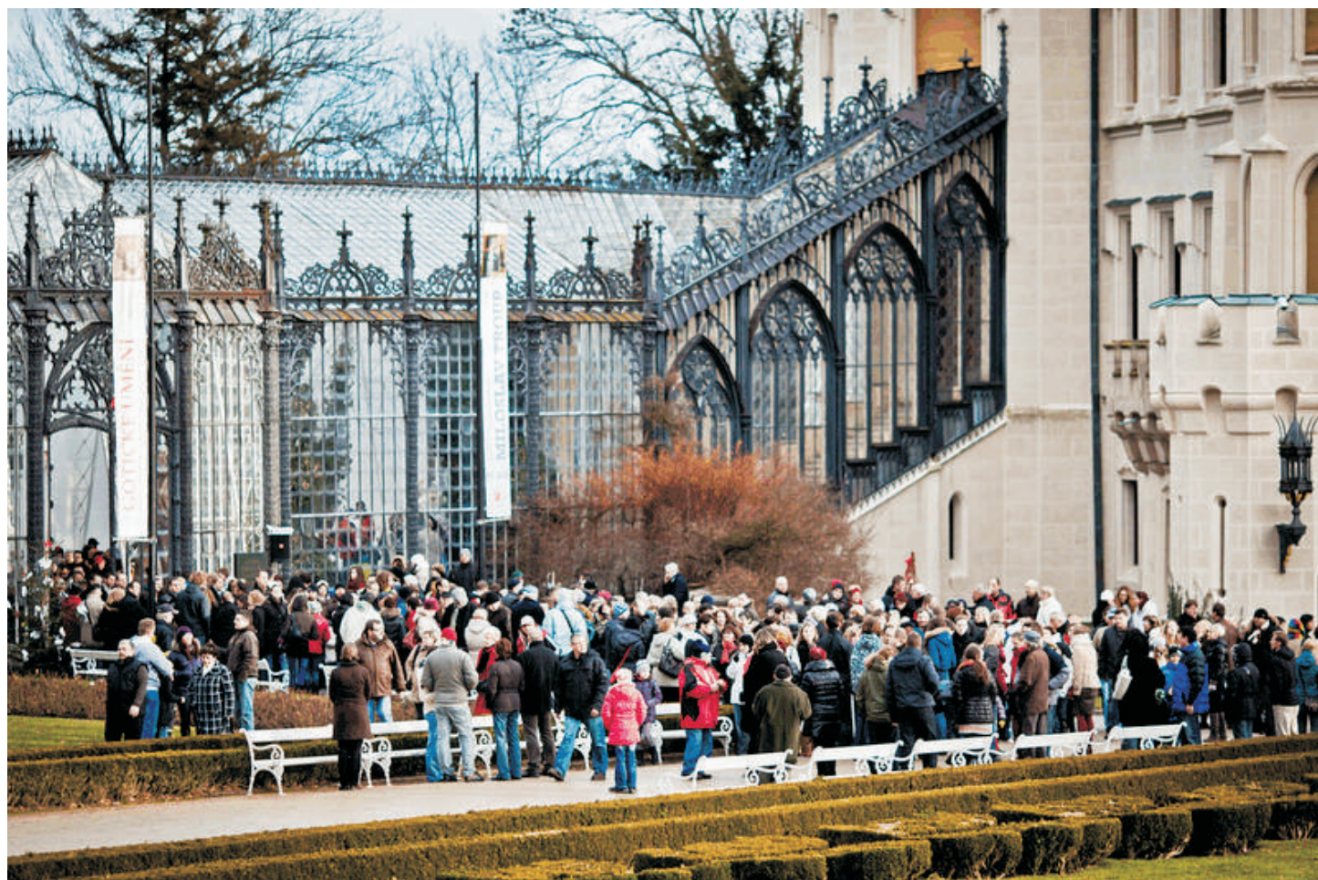
Štědrý den roku 2011, zámek Hluboká.