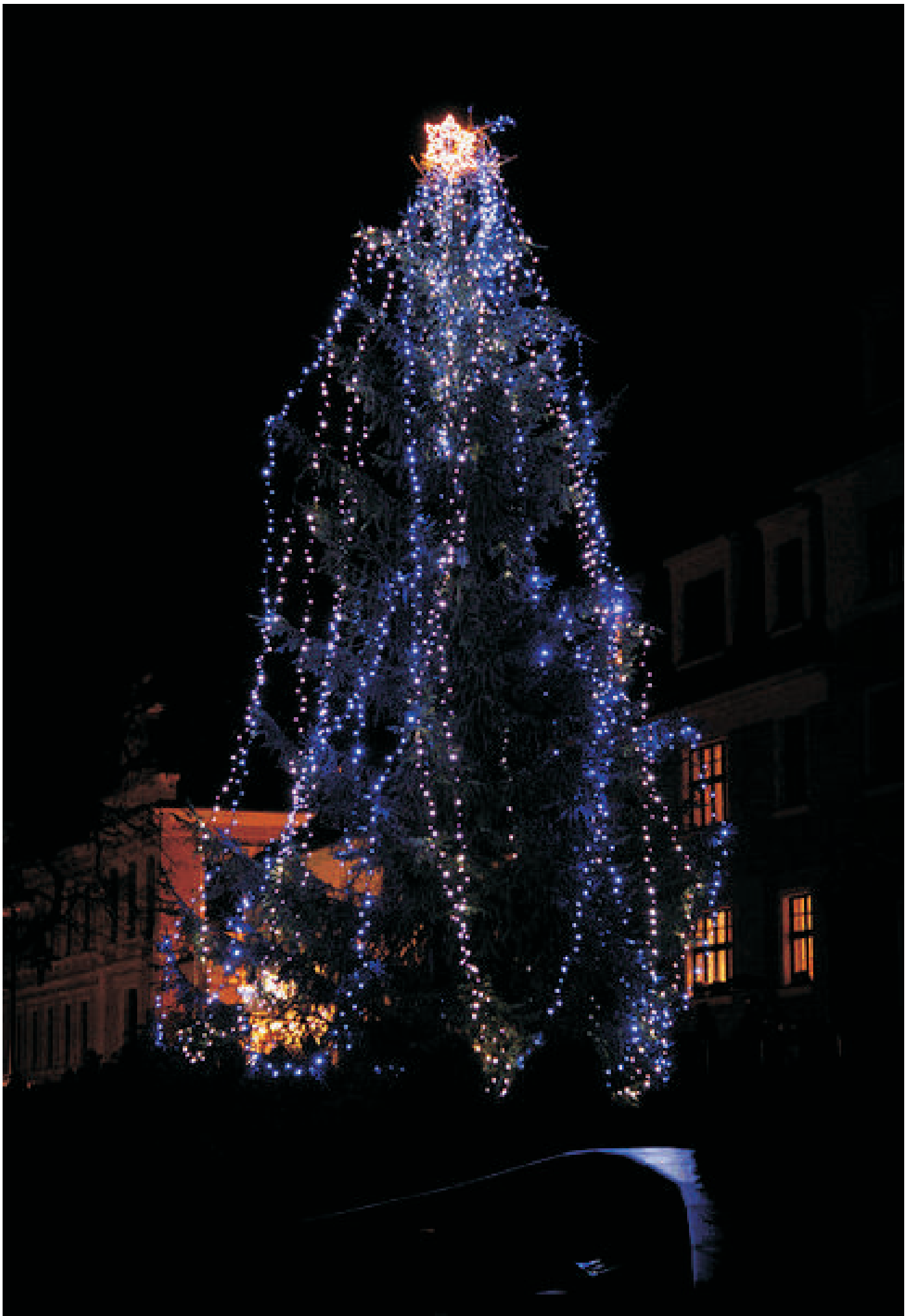
Vánoční strom.