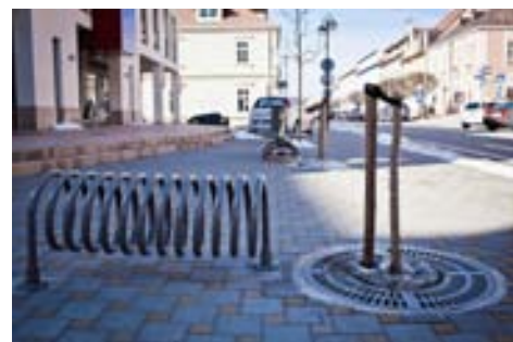
Foto všech nových provozoven a smutných zlomených stromů: Jan Pirgl