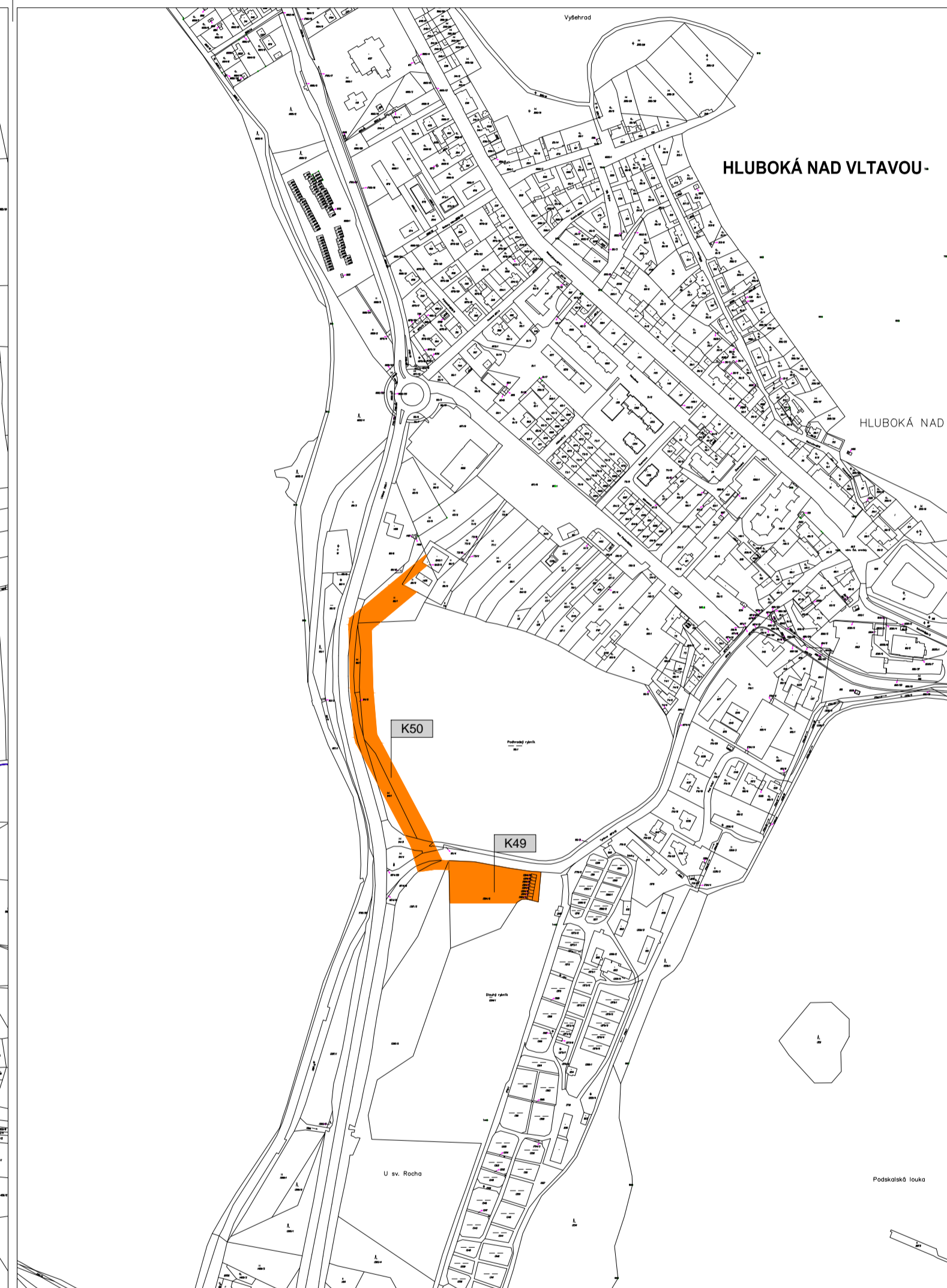
katastrální území HLUBOKÁ NAD VLTAVOU