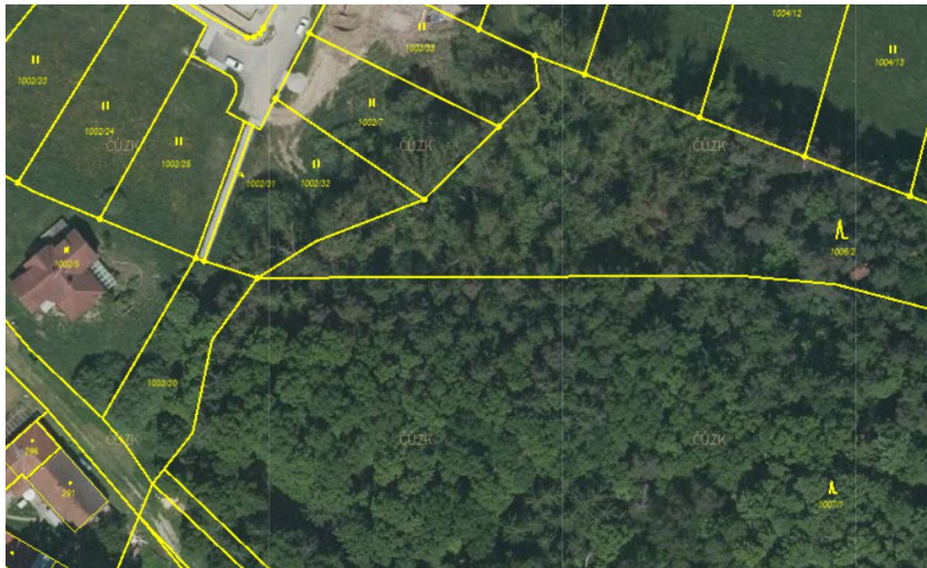
Výřez z KM – snímek z katastrální mapy + ortofotomapa

Dle recentní judikatury Nejvyššího správního soudu se odkazuje na přímo přílehlý les, tj. pozemky p.č. 1007/1, 1007/2, 1006/2, které jsou ve vlastnictví Lesy ČR, s.p. a.které jsou přístupné z veřejné komunikace na p.č. 1749/5 (Fibichova ulice).