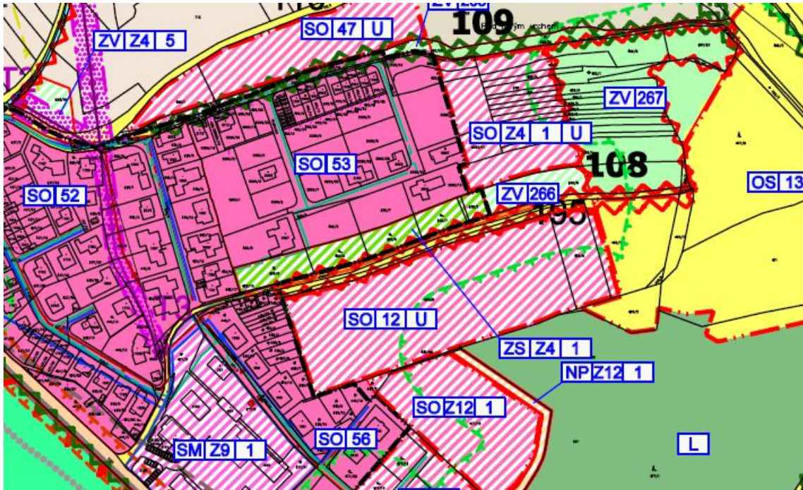
Výřez z ÚP – před změnou

Povinnost zpracování územní studie se vypouští rovněž z plochy SO.Z4.1. I v tomto případě bylo uspořádání území prověřeno územní studií a následně bylo vydáno územní rozhodnutí o umístění stavby ZTV.