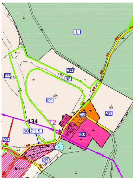
Výřez z ÚP – k.ú. Poněšice

Návrhem dochází k záboru ZPF, nedojde však k narušení celistvosti zemědělsky obhospodařovaných ploch.