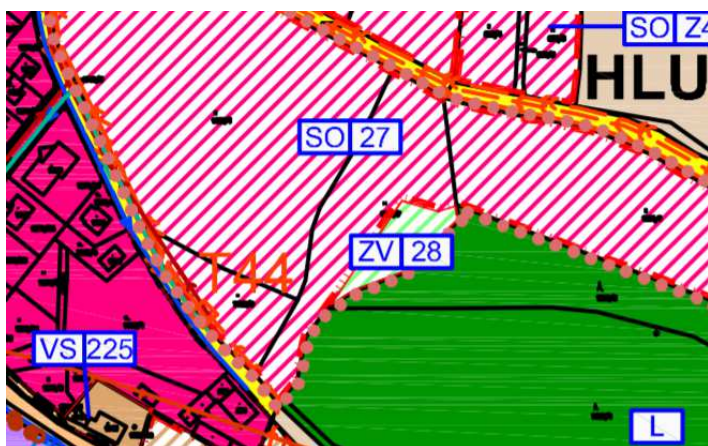
Výřez z ÚP – k.ú. Hluboká nad Vltavou „Zámostí“

SO.27, ZV.28 – lokalita „Zámostí“ – předmětem řešení je změna polohy veřejného prostranství v rámci pozemku p.č. 1002/7 k.ú. Hluboká nad Vltavou (BPEJ 55211 – IV. třída ochrany). Vynětí ploch ze ZPF bylo předmětem původní ÚPD, celkový zábor se nemění.