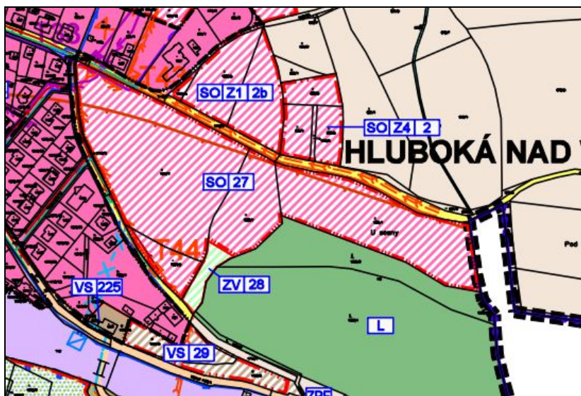
Výřez z ÚP Hluboká nad Vltavou – hlavní výkres

Výměra plochy ZV.28 (1.200m 2 ) byla stanovena na základě velikosti vymezené zastavitelné plochy SO.27 (3,81 ha vč. komunikací), v souladu s požadavky § 7 odst. 2 vyhlášky č.501/2009Sb.