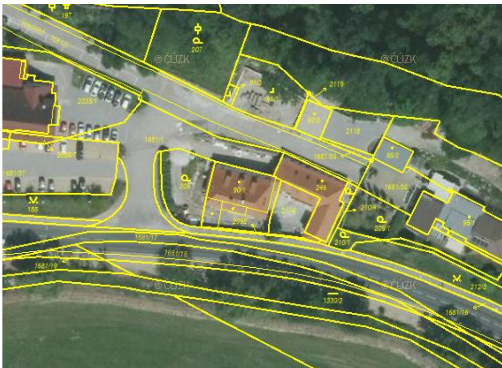
Obrázek 1 - řešené území dle ČÚZK, 08/2020

Změna č. 17 ÚPnZ vychází z aktuálního stavu a podmínek v řešeném území. Řešení návrhu změny vychází i z urbanistické koncepce vydané ÚPnZ včetně jeho změn, které reagovaly na potřeby rozvoje města a jeho částí. Návrh změny ÚPnZ vytváří předpoklady pro výstavbu a trvale udržitelný rozvoj území vyváženým řešením a rozvojem podmínek pro hospodářský rozvoj a pro soudržnost společenství obyvatel území, při zachování a vytváření podmínek pro příznivé životní prostředí, respektováním kulturního a architektonického dědictví a ochrany přírody. V řešeném území změny č. 17 ÚPnZ nejsou nově vymezeny plochy, ve kterých je potřeba jejich další využití prověřit územní studií.