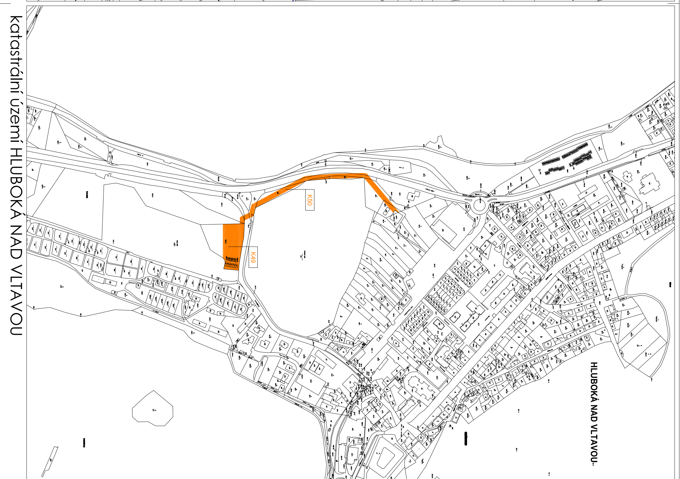
katastrální území HLUBOKÁ NAD VLTAVOU