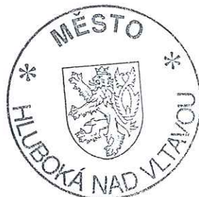
starosta města Ing. Tomáš Jirsa