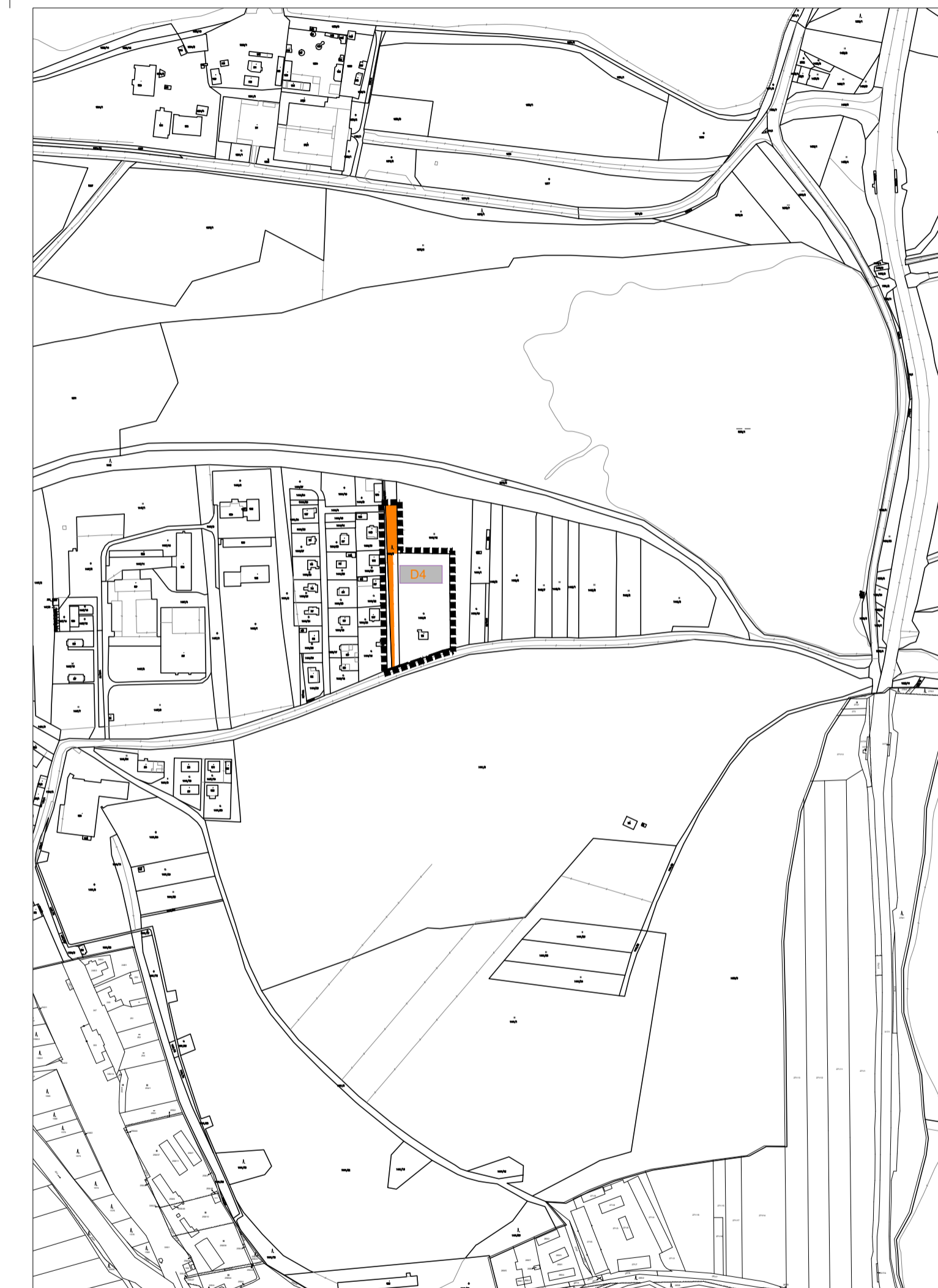
LOKALITA Č. Z.6.B. - SUDÁRNA